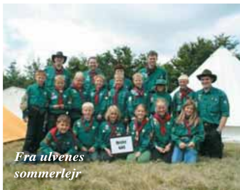
Fra ulvenes sommerlejr