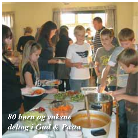
80 børn og voksne deltog i Gud & Pasta

På modtagernes vegne: Hjertelig TAK for gaven